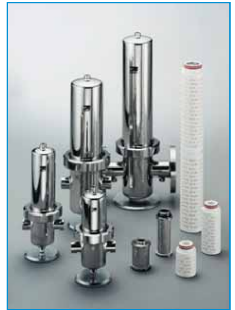
Abbildung: Einsatzbereiche der wichtigsten Prozessgehäuse

Beispiel: Bei einem Taupunkt von 0° C enthält ein m 3 Umgebungsluft 4,868 g Feuchtigkeit